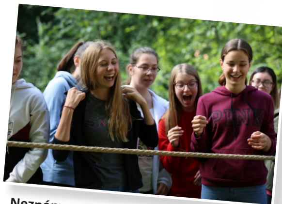
Neznáme se, poznáme se!