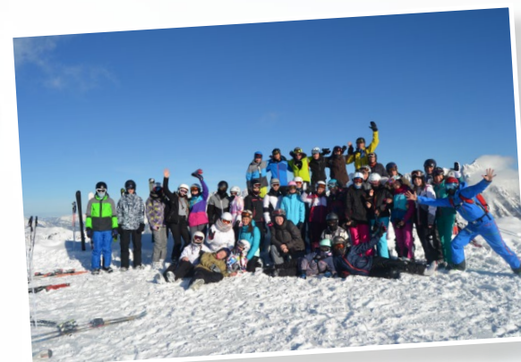
Na lyžích v Alpách