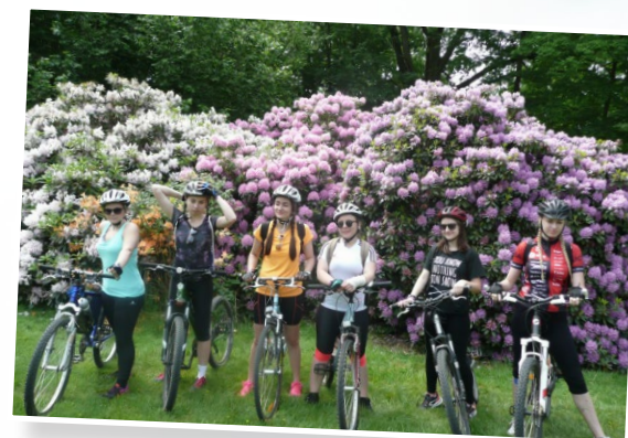
Cyklisti v Doksech