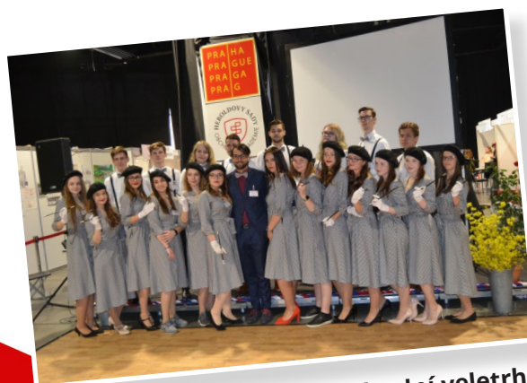
Mezinárodní veletrh fiktivních firem