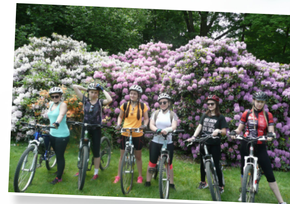
Cyklisti v Doksech