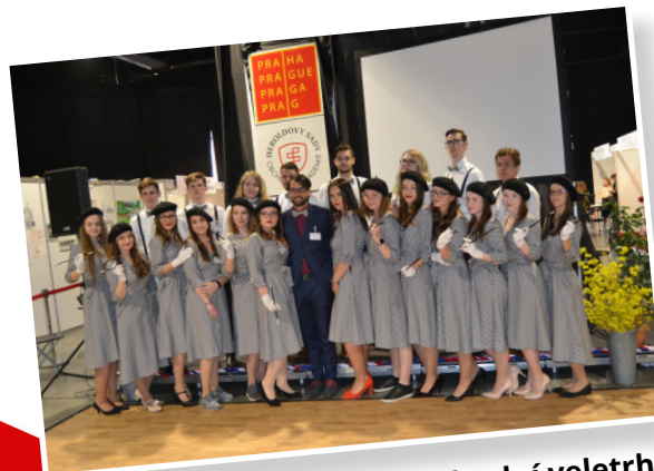
Mezinárodní veletrh fiktivních firem